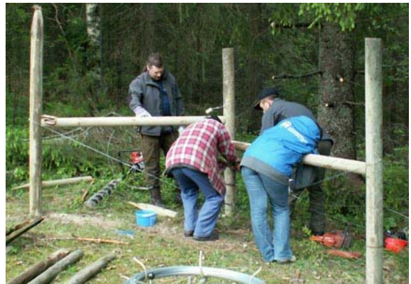
Flitiga stängselbyggare vid vårens stängselkurs.

En tänkbar mekanism bakom detta kan vara att man åtminstone i de vargrevir där det betalats ut mycket stängselbidrag har blivit medveten om att myndigheterna faktiskt tar just deras problem på allvar och försöker minimera dem. Det har hittills inte gått att visa att antalet angrepp blivit mindre i ett vargrevir tack vare stängselbidragen, så ett faktiskt minskat antal angrepp är inte anledningen till att inställningen till varg varierar mellan reviren.