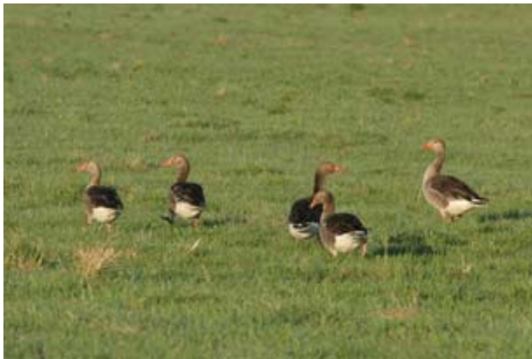
Grågåsens enorma ökning i antal under de senaste 20 åren ställer till allt mer problem i jordbruksområden i landet.